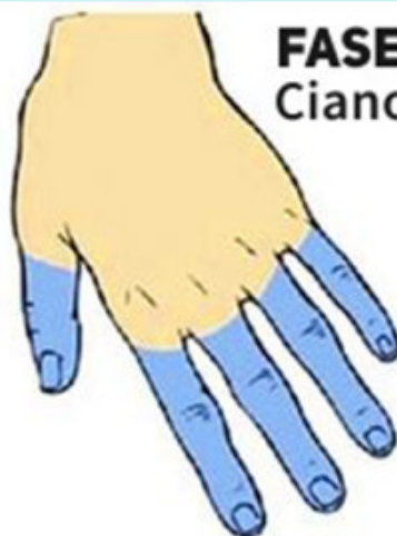
FASE 2 Cianose