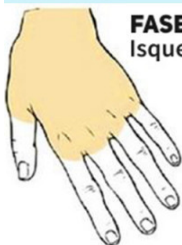
FASE 1 Isquemia