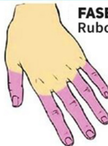
FASE 3 Rubor