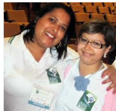
Pri e Lalá